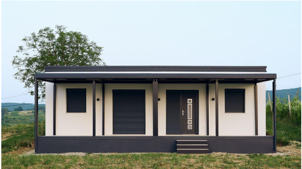
Prednja strana pogled 1