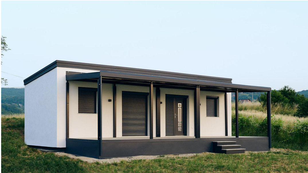
Prednja strana pogled 3