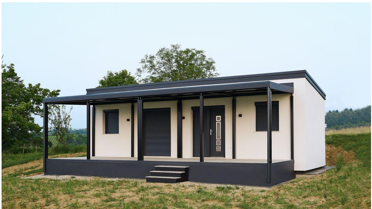
Prednja strana pogled 2